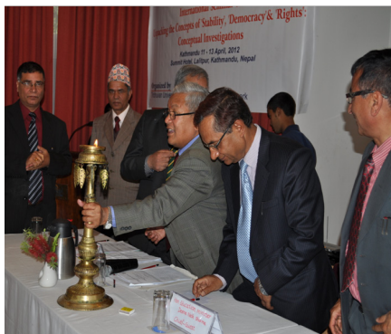
Billed: Et lys bliver tændt for samarbejdet i Nepal