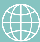
Loft over engelsksprogede studerende