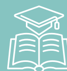
Loft over optag på kandidatuddannelser